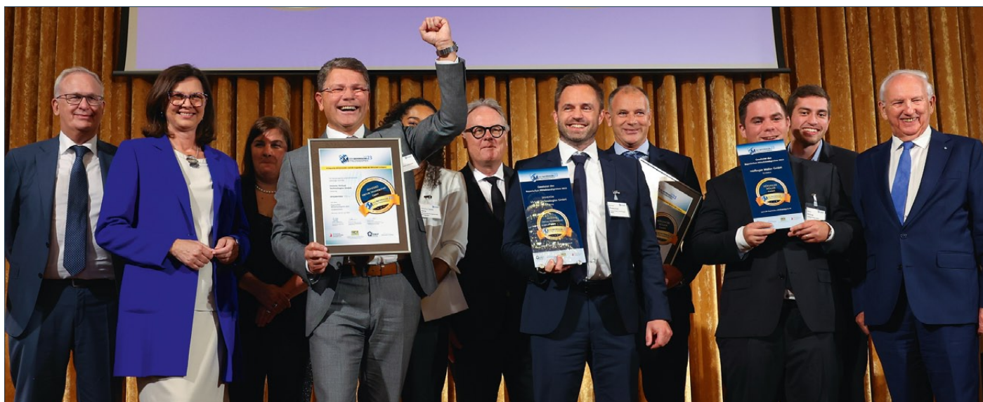
Bei der Preisübergabe: Landtagspräsidentin Ilse Aigner mit den zwei Preisträgern Invenio Virtual Technologies GmbH und Höflinger Müller GmbH sowie Vertretern der Jury und der Veranstalter

Am Freitag, 23. Juni 2023, fand die 14. Verleihung des BAYERISCHEN MITTELSTANDSPREISES im Münchner Künstlerhaus am Lenbachplatz statt. Veranstaltet von unserem Partner der Verbandsgruppe Wir Eigentümerunternehmer und der Hochschule für angewandtes Management (HAM) sowie mitgetragen vom IMU e.V. wurde die Verleihung für alle Finalisten und Sieger – allesamt top bayerische Mittelständler – und alle Beteiligten wieder ein rauschendes Fest!